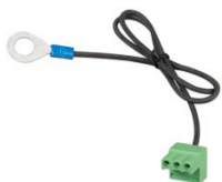
Conector cu cablu negativ de CC pre-asamblat (inclus)

BatteryProtect deconectează bateria de la toți consumatorii neesențiali înainte ca aceasta să fie complet descărcată (ceea ce o poate deteriora) sau înainte de a avea suficientă energie pentru a porni motorul.